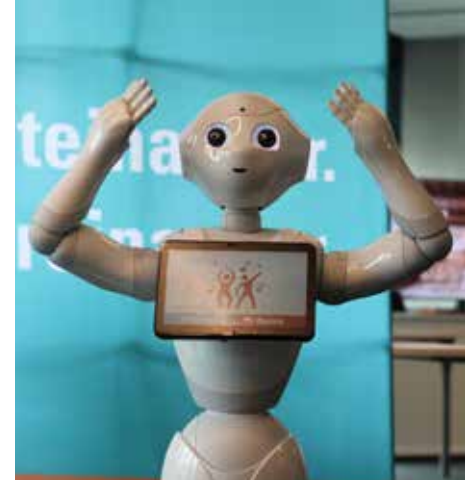
Pepper singt und tanzt