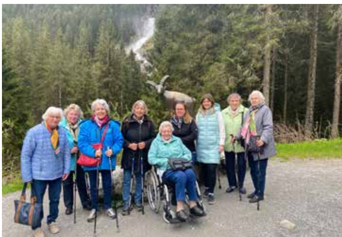
Die Tettenweiser vor den Krimmler Wasserfällen

Ein Urlaub, der in Erinnerung bleibt. Die Teilnehmer freuen sich schon jetzt auf den nächsten Urlaub.