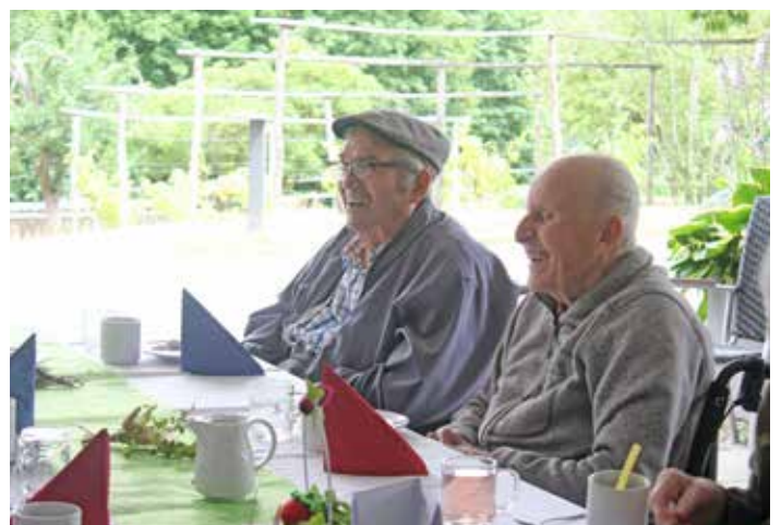
Gute Stimmung unter den Bewohnern von Kollbach