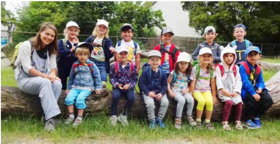
Gruppenfoto im Wildpark Ortenburg

Bevor die Heimreise angetreten wurde, gabs das obligatorische Eis und für alle noch ein Erinnerungsfoto für das Kindergartenalbum. Alle waren sich einig, dass sie gemeinsam einen wunderschönen Tag im Tierpark erlebt haben.