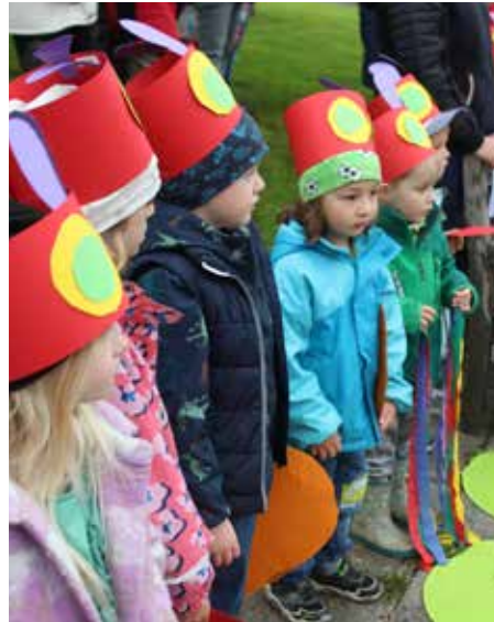
Die Kinder bei ihrem Auftritt