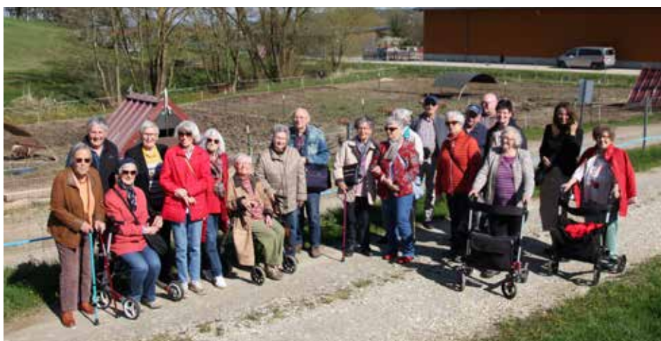
Die Senioren vor dem Mutterschwein-Gehege mit Abferkelhütte

Am Ende des Ausflugs gab es für jeden Ausflügler eine wunderbar rauchig-würzige Handwurst, die sich die Bewohner schmecken ließen. Vielen herzlichen Dank für die tolle Bewirtung, die Führung und die Einblicke, die die Senioren gewinnen durften!