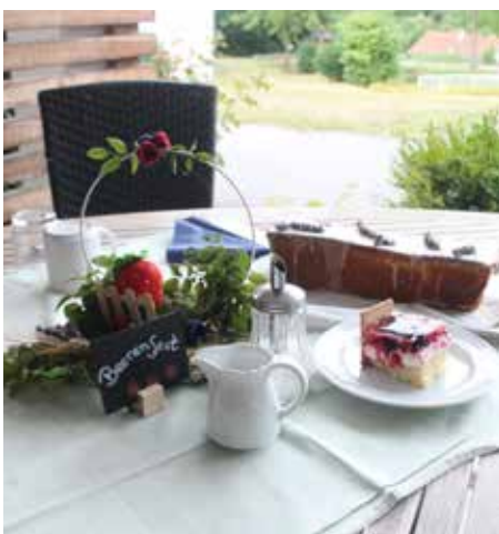
Beerige Deko im Bereich Kollbach