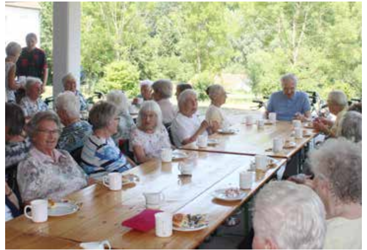
Gemütliches Beisammensein im Betreuten Wohnen

Arnstorf. Bei sommerlichen Temperaturen waren die Bewohner vom Betreuten Wohnen zum Gesellschaftsnachmittag im Freien eingeladen. Der Freisitz Steinbach war dazu der schattige Treffpunkt. Das Betreuungsteam hatte einen abwechslungsreichen Nachmittag vorbereitet, der mit einem Kaffeepausch begann. Sie servierten, zusammen mit dem Team vom Café, Schmalzgebackenes und leckere Quarkbällchen. Lustig war es beim Bayern-Quiz, wo es knifflige Fragen zu beantworten gab. Außerdem mussten bayerische Begriffe, wie zum Beispiel „Bosbod“ ins Hochdeutsche „Briefträger“ übersetzt werden. Für alle Nicht-Bayern unter den Besu-