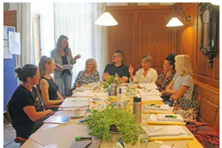
Konzentriertes Arbeiten in der Bauernstube

Herzlichen Dank an alle Teilnehmerinnen und Teilnehmer für die engagierte Zusammenarbeit!