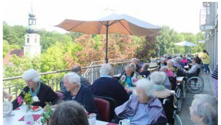
Auf der schattigen Terrasse in den Hausgemeinschaften