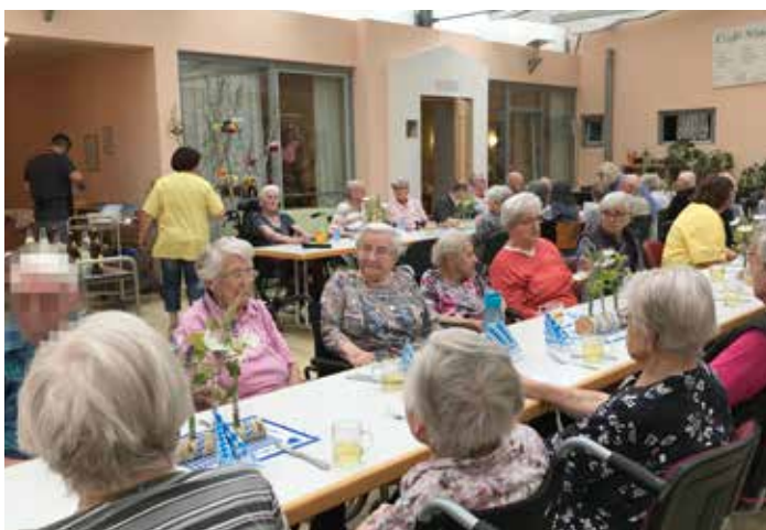
Vorfreude auf das Grillen in den Hausgemeinschaften

Zu einem Biergartenbesuch mit Musik waren die Bewohner vom Wohnbereich Rottal eingeladen. Dazu nahmen sie draußen auf der bayerisch dekorierten Terrasse Platz und freuten sich, wieder einmal dort das Mittagessen einzunehmen.