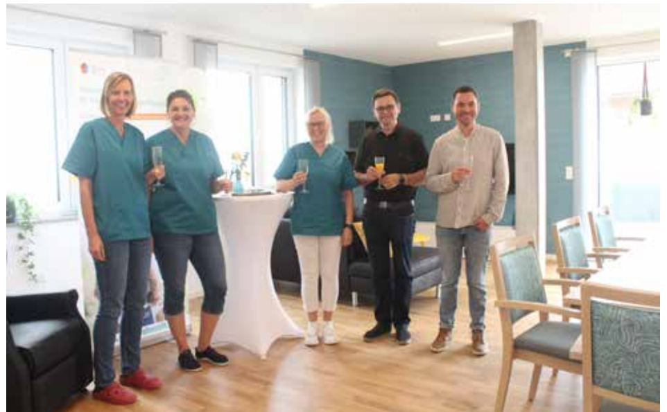
Ein Gläschen Sekt zum Anstoßen darf natürlich nicht fehlen

Sehr einladend wirken die modernen, hellen Räumlichkeiten mit großen Panoramafenstern, welche auf über 220 Quadratmetern entstanden sind. Den Anfang macht der Eingangsbereich mit Garderobe, wo sich persönliche Ablagefächer für die Gäste befinden. Im großzügigen Wohnraum bildet die offene Wohnküche den Mittelpunkt der Einrichtung. Die Küche soll den Besuchern der Tagespflege Platz zum gemeinsamen Kochen bieten. Durch die entstandene Raumgestaltung findet jeder Gast im Wohnbereich ein eigenes bevorzugtes Plätzchen zum Ver-