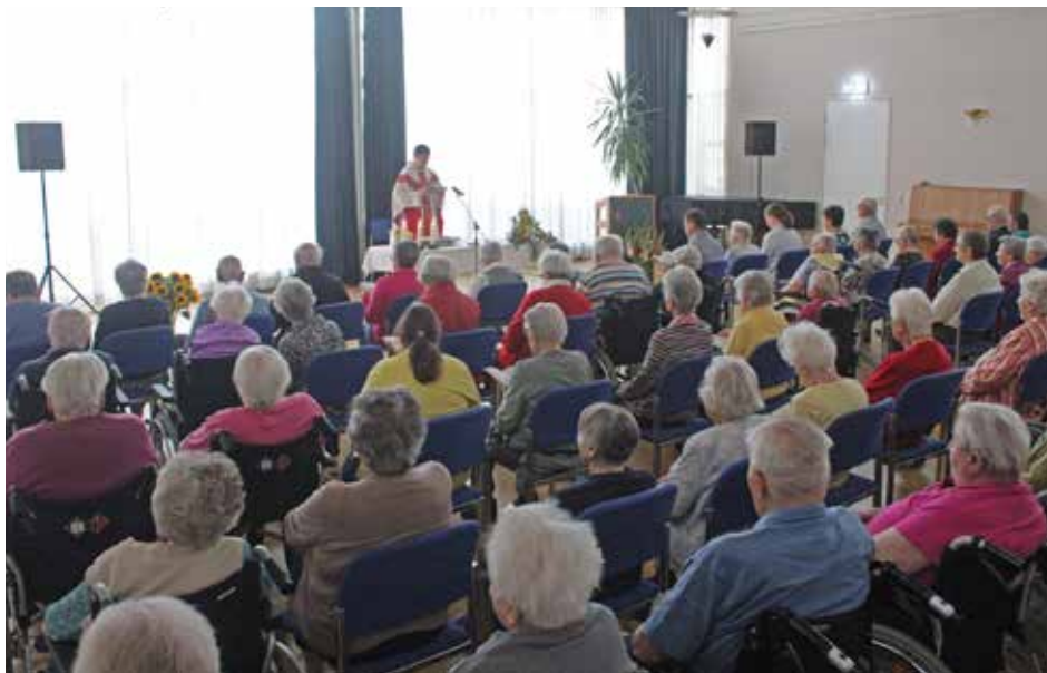
Gut besuchter Gottesdienst im Festsaal