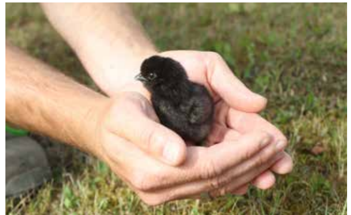
Wenige Tage altes Küken