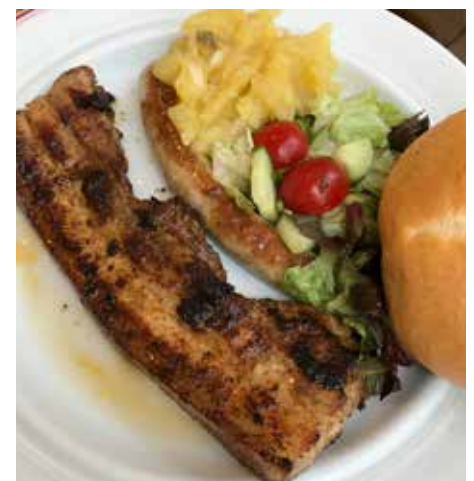
So schmeckt der Sommer