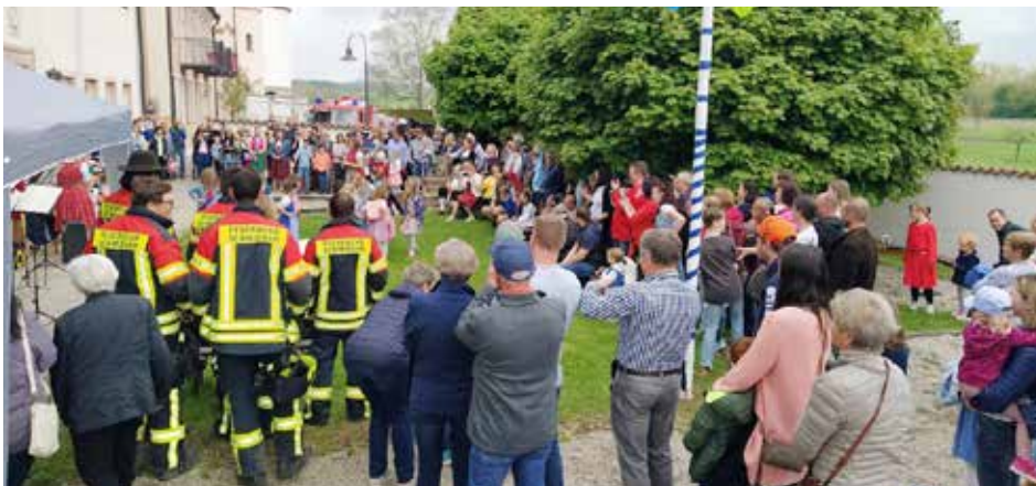
Viele fleißige Helfer stellten den Maibaum auf

einen Tanz zu dem Lied „Bin i ned a schena Hahn“ auf. Und da sich nun auch die Sonne gegen die Wolken durchsetzte, konnte das Fest, musikalisch umrahmt von den Martinsbläsern Tettenweis, einen fröhlichen Verlauf nehmen. Für die Kinder hatte das Kitateam verschiedene Spielstationen aufgebaut. Wer danach eine Stärkung brauchte, fand diese bei Gegrilltem, Kaffee und Kuchen.