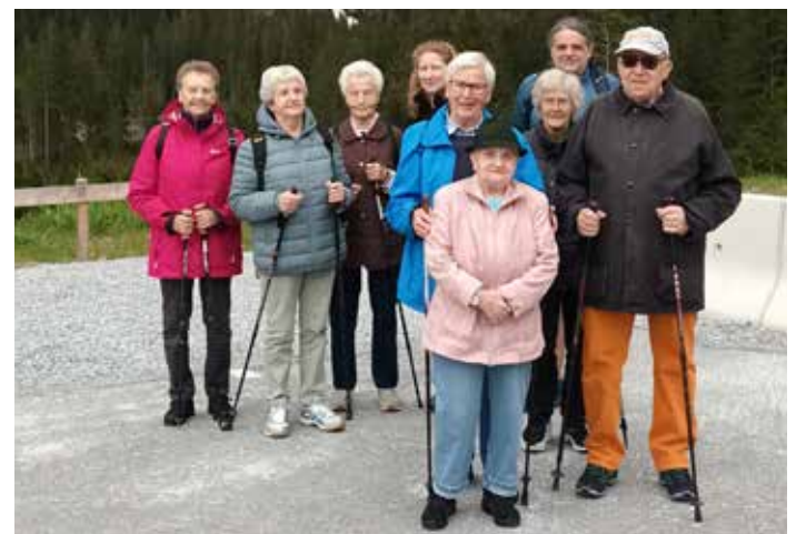
Die Arnstorfer vor den Krimmler Wasserfällen