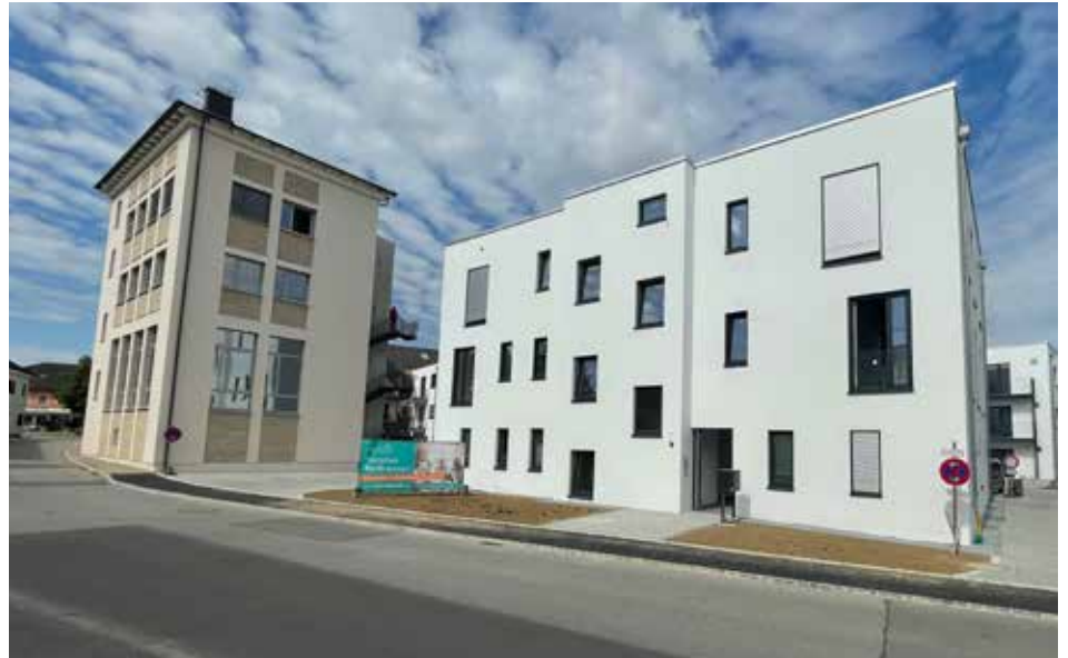
Das ehemalige Lang Bräu mit markanten Gebäuden erstrahlt in neuem Glanz

nerin vor Ort, erklärt, beginnt der Tag mit einem gemeinsamen Frühstück. Daran schließen sich eine Zeitungsrunde und Bewegungsangebote an. Nach dem Mittagessen können sich die Senioren zu einem Mittagspäuschen in einen der beiden Ruheräume zurückziehen. Diese sind mit bequemen Liegesesseln und Betten ausgestattet. Kaffeetrinken, Spiele und andere Angebote komplettieren den Tag – zwingend mitmachen muss hier allerdings keiner etwas. Wer sich beispielsweise lieber auf die Terrasse sitzen möchte oder ein Buch lesen möch-