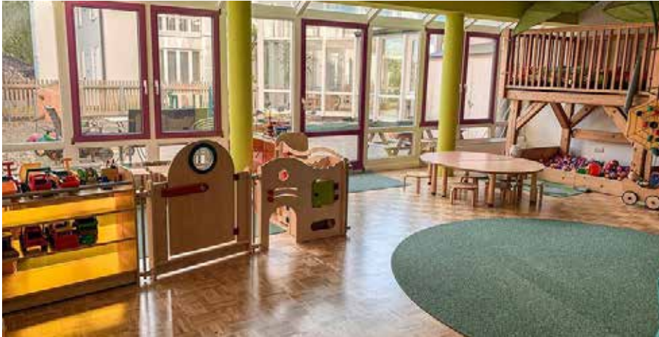
Die Räumlichkeiten des Zwergentreffs erstrahlen in neuem Glanz

zeigte vollen Körper- und Stimminsatz, um den Kleinen (und manchmal auch den Eltern) ein Lachen zu entlocken. Ein Aufwand, der sich definitiv gelohnt hat, wenn man sich die großartigen Fotos ansieht.