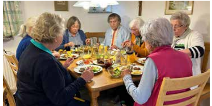
Gemütliches Beisammensein am Grillabend

Kuchenspezialitäten kamen die Senioren bei einem Besuch in einem Kaffeehaus, bei dem sich die Senioren rege über die Erlebnisse des Tages austauschten.