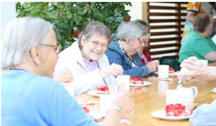
Erdbeerkuchen und Kaffee im Freisitz

Auch die Hausgemeinschaften organisierten ein Erdbeerfest auf der Terrasse. Die Bewohnerinnen und Bewohner erwarteten liebevoll dekorierte Tische, musikalische Begleitung, Erdbeerkuchen und Erdbeerbowle. Ein kreatives Programm mit Mitsprechgedichten, lustigen Einlagen und Bewegungsgeschichten rundete das Fest ab. Die Bewohner schätzen die Atmosphäre bei diesem Fest sehr, bei dem sie genussvoll schlemmen und sich gut unterhalten können – ein gemütlicher Nachmittag in geselliger Runde.