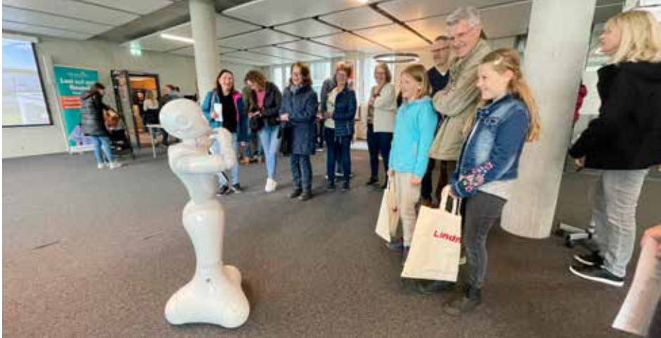
Ein echter Hingucker – der Pflegeroboter Pepper begeistert Jung und Alt

Wir sagen ganz herzlich Danke – an alle, die diesen Tag möglich gemacht haben. Ein großes Dankeschön geht auch an alle Kolleginnen und Kollegen, die uns mit ihren Familien besucht haben. Es war ein rundum gelungener Tag!